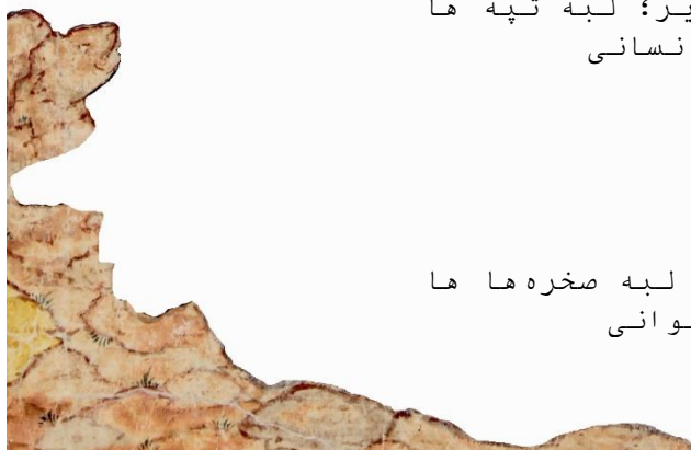
تصویر ۳ بخشی از تصویر؛ لبه صخره ها ها به شکل سر حیوانی

استفاده فراوان از طراحی آب در نگاره‌های شاهنامه کتابخانه کاخ سعدآباد، قابل توجه است. تمامی آب‌های نقاشی شده به دلیل استفاده از نقره در حال حاضر به رنگ سیاه درآمده‌اند.