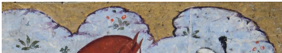
تصویر ۱ بخشی از تصویر؛ استفاده از رنگ تیره‌تر در قسمت لبه تپه‌ها و جداسازی آنها از فضای پس‌زمینه

زمین نزدیک به رودخانه یا چشمه‌ها به صورت چمن سبز و نسبتاً پر گل‌تر نسبت به قسمت‌های انتهایی پس‌زمینه نقاشی شده است. صخره‌ها یا تپه‌ها اغلب به صورت کاملاً ساده تصویر شده‌اند که البته با سایه روشن‌هایی کمی تیره‌تر در قسمت لبه‌ها برای جداسازی آنها از آسمان استفاده شده است. (تصویر ۱) در برخی موارد شکل صخره‌ها به صورت سر انسان یا حیوان و به صورت تک رنگ به تصویر درآمده‌اند. (۲ و ۳)