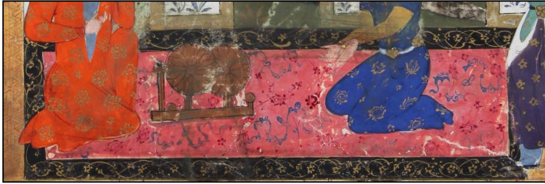
تصویر ۱۱قالی بزرگ پارچه با طرح افشان با تزئینات ابر چینی و بندهای ختایی، دارای رنگهای گرم، شاهنامه کاخ سعدآباد