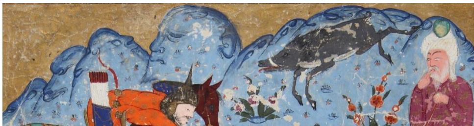
تصویر ۲ بخشی از تصویر؛ لبه تپه ها به شکل سر انسانی