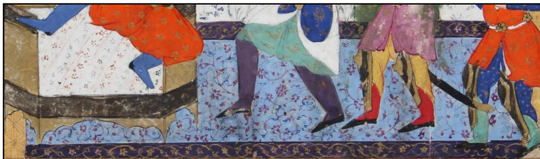
تصویر ۱۰ قالی بزرگ پارچه با طرح افشان با تزئینات بندهای ختایی، دارای رنگ‌های سرد، شاهنامه کاخ سعدآباد

تضاد رنگی کاملاً واضحی در متن و حاشیه و حتی تزئینات روی فرش‌ها دیده می‌شود که در هماهنگی با سایر عناصر ترکیب‌بندی در نگاره‌ها همخوانی و تناسب دارد. همین امر موجب درخشش و جلای رنگی آنها نیز شده است زیرا نقوش در حاشیه به صورت تک رنگ و معمولاً به رنگ طلایی یا آکر، روی یک زمینه سورمه‌ای یا مشکی کار شده و در متن یا زمینه از روش تیره - روشن برای نشان دادن تزئینات استفاده شده است به طوری که رنگ زمینه اگر آبی یا صورتی کم‌رنگ بوده برای نقوش روی آن علاوه بر به کار بردن رنگ‌های آبی تیره‌تر یا قرمز تیره‌تر از یک رنگ متضاد دیگر هم استفاده شده است.