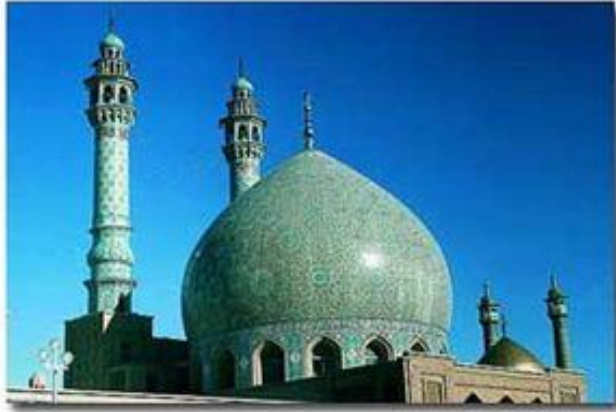
مسجد اعظم قم از آثار استاد لرزاده.