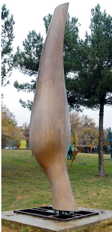
بدون عنوان، برنز، ۱۹۷۷، موزه هنرهای معاصر تهران