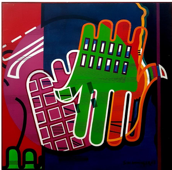
رنگ و روغن روی بوم، ۹۰×۹۰، موزه هنرهای زیبا، مجموعه سعدآباد

الگوی الماسی آثار مجسمه‌سازی او، از وسواسش در هندسه‌های پیچیده و اشکالی که در ابتدا ممکن است با منطق مخالفت کنند، خبر می‌دهد.