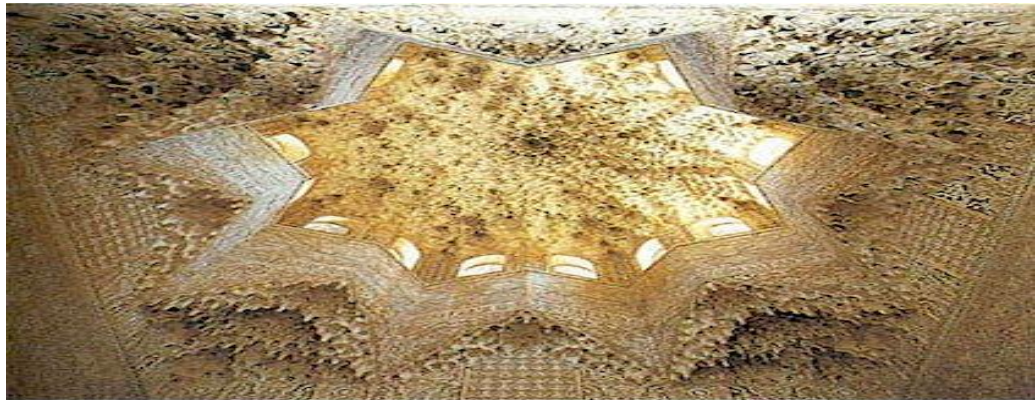
Hall of the Abencerages (Alhambra) showing the Honey comb dome.

حمامها آخرین قسمت با اهمیت حرم هستند که نمیتوان به آن داخل شد، اما میتوان درون آنرا از میان پنجره تماشا کرد.