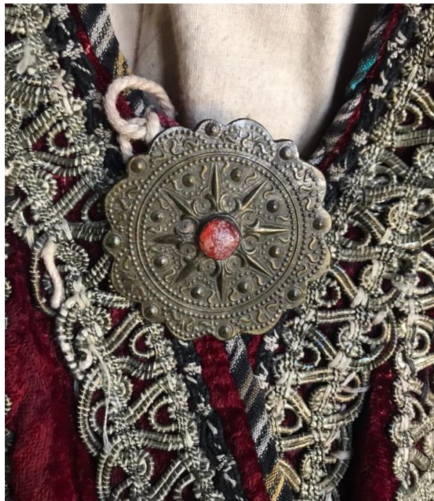
تصویر شماره ی ۳: دکمه به همراه نگین از جنس عقیق مربوط به اواخر دوره قاجار