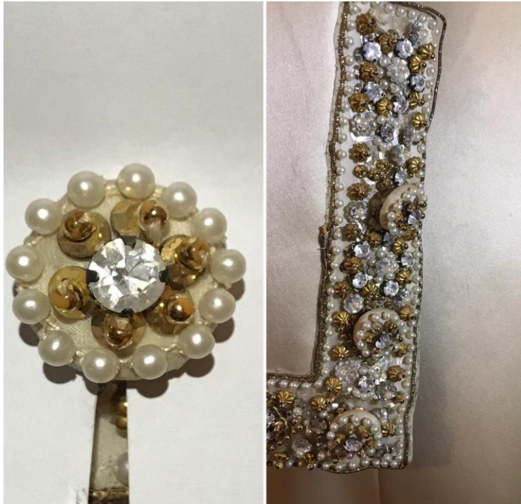
تصویر شماره ی ۶: دکمه با تزئینات سنگ و مروارید مربوط به دوره ی پهلوی