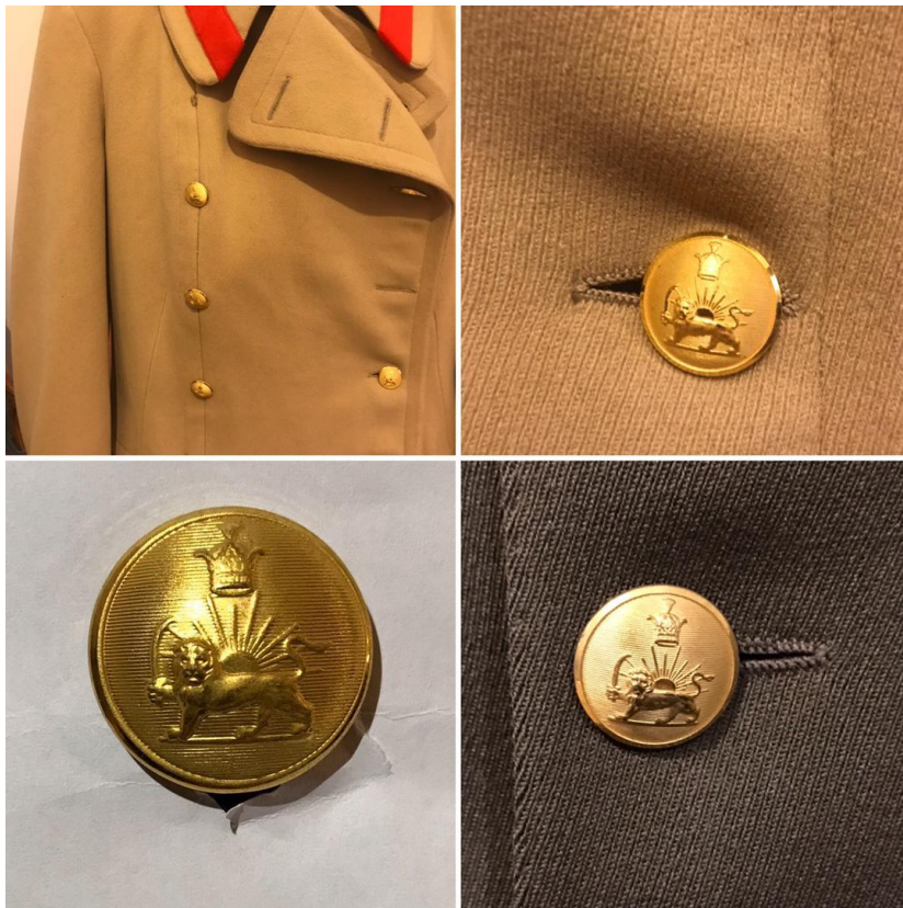
تصویر شماره ی ۵: دکمه از جنس برنج با روکش آب طلا- ساخت کارخانه ی اسپرونگ سوئد مربوط به دوره ی پهلوی اول و دوم