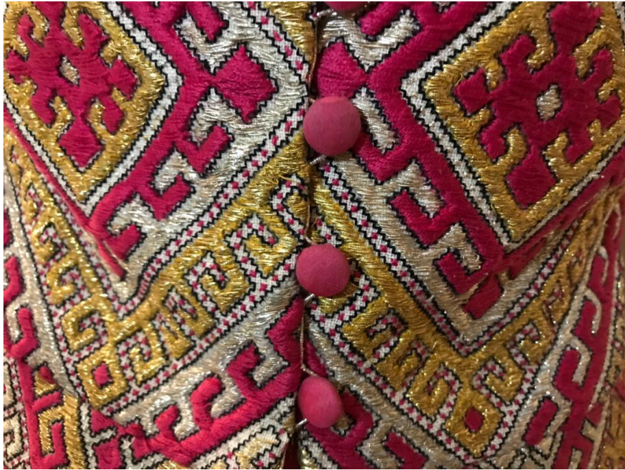
تصویر شماره ی ۸ : دکمه از جنس پارچه زمینه ی پیراهن نصب شده بر روی لباس با سوزندوزی بلوچ- مربوط به دوره ی پهلوی دوم