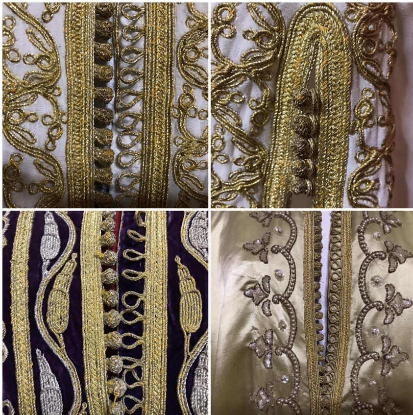
تصویر شماره ی ۷: دکمه از جنس قیطان حاوی گلابتون طلا موجود در کفتان های اهدایی کشور مراکش - مربوط به دوره ی پهلوی دوم