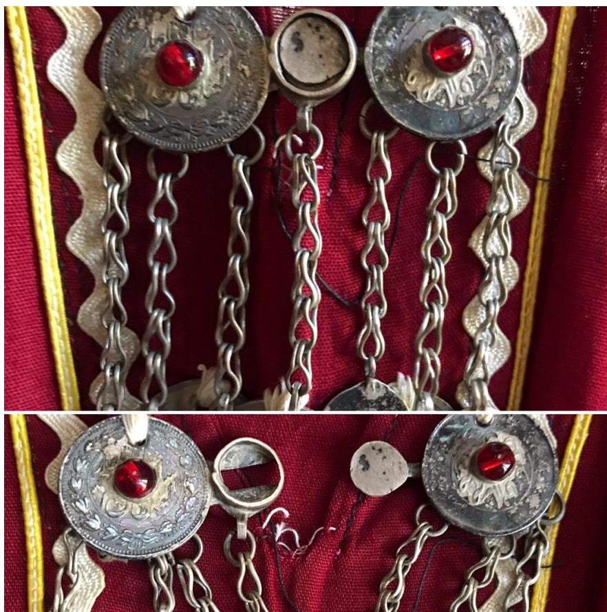
تصویر شماره ۱: دکمه به شکل قزن از جنس سکه مربوط به دوره ی قاجار

- استفاده از دکمه از جنس قیطانهای دارای گلابتون نقره و طلا که به صورت زائده ی گلوله شکل و بندینک که با قلاب بافته شده است و عمدتاً بر روی لباسهای مراکشی فرح دیبا که اهدائی پادشاه مراکش سلطان حسن دوم می باشد نیز رایج بوده است.