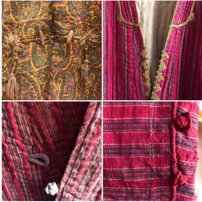
تصویر شماره ی ۴: دکمه از جنس ابریشم و گلابتون بافته شده با قلاب موجود در آرشیو لباسهای مربوط به اقوام ایرانی