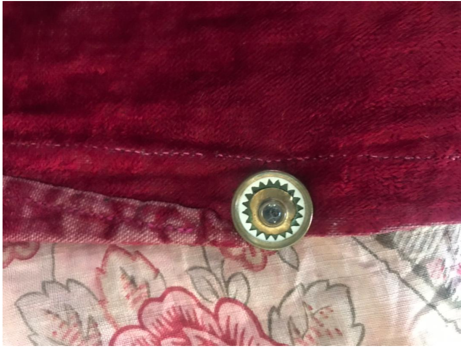
تصویر شماره ی ۲: دکمه با تصویری از خورشید و یک نگین تزئینی مربوط به دوره ی قاجار