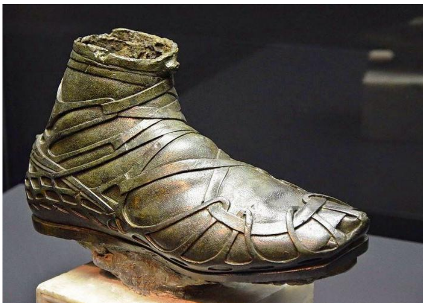
نمونه ی کفش سربازان مادی و پارسی با بندی بلند برای بستن به دور ساق پا

بنا بر آنچه که در اسناد تاریخی به جای مانده ، زمانی که نخستین زیستگاه انسانی در حوالی کرمانشاه امروزی بنا شد، مردم پاپوشی از پارچه و بندی برای بستن به دور مچ پا داشتند. این نوع کفش بعدها با تغییرات اجتماعی به کفش مخصوص طبقه ی عامه مردم و طبقه اشرافی تبدیل شد که حکایت از مرتبه ی اجتماعی افراد داشت.