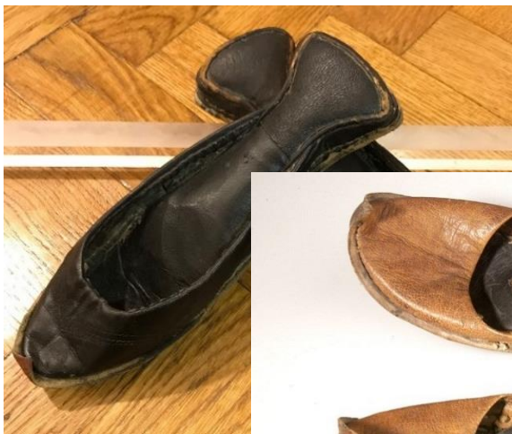
ساغری های موجود در موزه پوشاک سلطنتی مجموعه ی سعد آباد