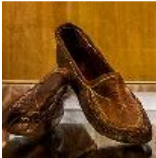
چارق از جنس چرم موزه پوشاک