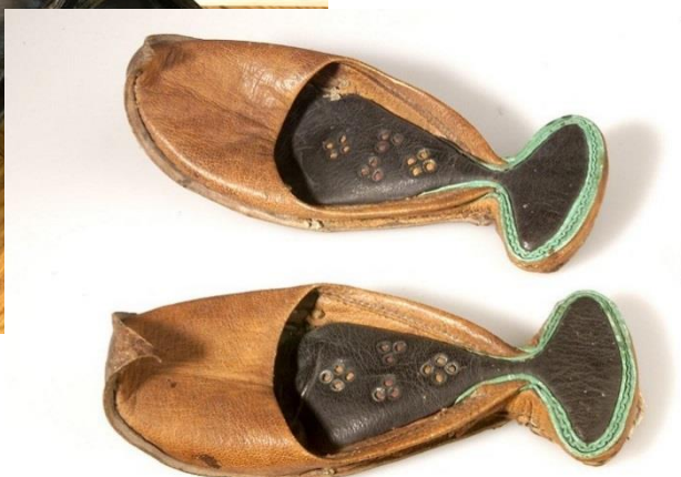
ساغری هاز جنس چرم