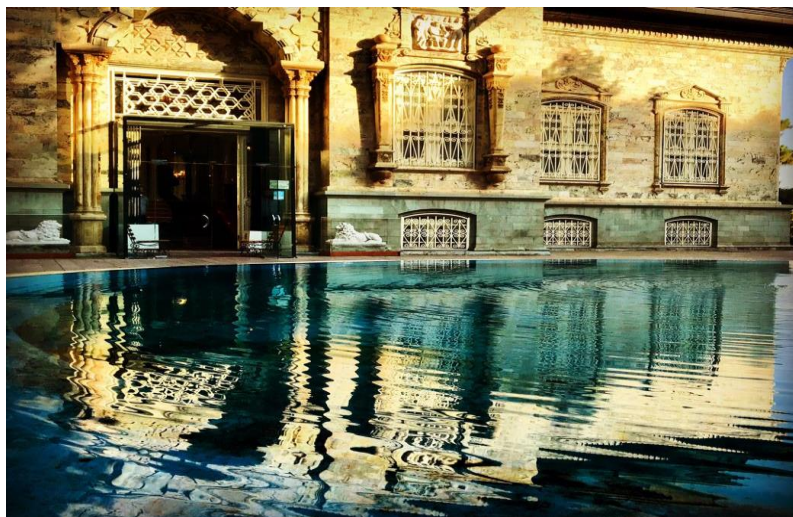
نمایی از کاخ سبز

- این کاخ در زمان رضا خان به کاخ سنگی معروف بوده و در زمان محمدرضا شاه به نام کاخ شهوند و اکنون به نام کاخ سبز معروف می باشد.