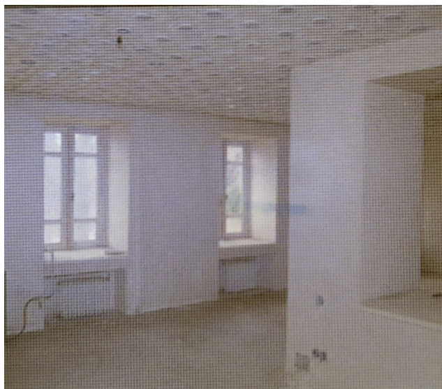
- تصویر ۹- بخش نصب شופاژ و سقف با نور فلور سنت ، طبقه همکف.