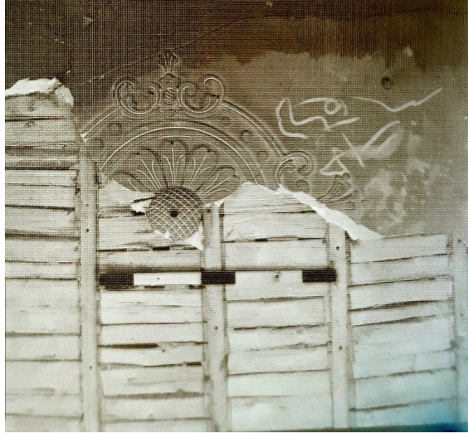
تصویر ۷- نقش گچ بری اولیه سقف طبقه اول موزه میرعماد - پیش از تغییر کاربری برای فرزندان پهلوی دوم ( منبع : واحد عکاسی سعد آباد).

شاهی نیاوران موسوم به کاخ رضا پهلوی و ساختمان تیمور تاش یا موزه جنگ دیده می شود در ساختمان موزه میرعماد اثری از تزئینات آجر تراش دیده نمی شود و گچ بری آن فقط در سقف طبقه اول ان بکاررفته که با استناد به مدارک تصویری ان که در سال ۱۳۷۵ در خلال طرح مرمت و تغییر کاربری از آن گرفته شده است روی این بخش از سقف را سقف کاذبی نصب کرده بودند که این موضوع نشان می دهد ساختمان مذکور در گذشته گچ بری و تراش سنگ داشته که در دوره پهلوی دوم برای بار اول تغییر کاربری داده و بر این بخش از سقف را پوشانده اند. (نک تصویر ۸ و ۷).