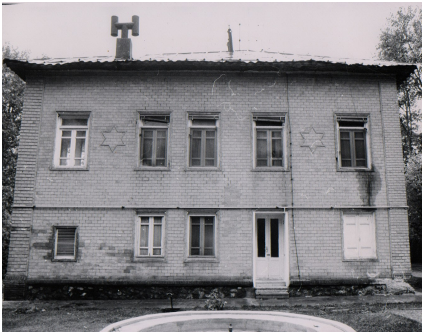
تصویر ۶- نمای شمالی ساختمان میرعماد در کاخ سعد آباد - پیش از تغییر کاربری سال ۷۶. (منبع: واحد عکاسی سعد آباد).