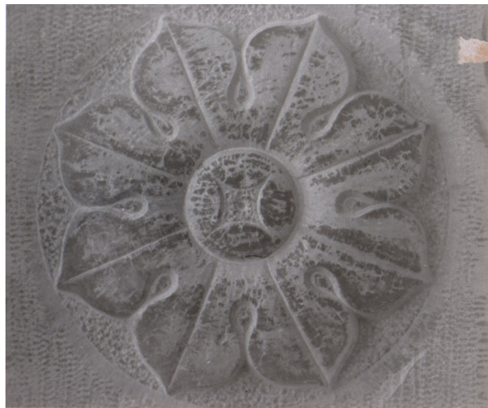
تصویر ۸- نقش تراش سنگ بر ازاره های سنگی بیرون ساختمان موزه میرعماد از دوره قاجار تا کنون ( منبع : واحد عکاسی سعد آباد).

آنچه تا پیش از تغییر کاربری این ساختمان تا سال ۱۳۷۵ مشاهده می شود بر اساس منابع تصویری بدست آمده است مانند :