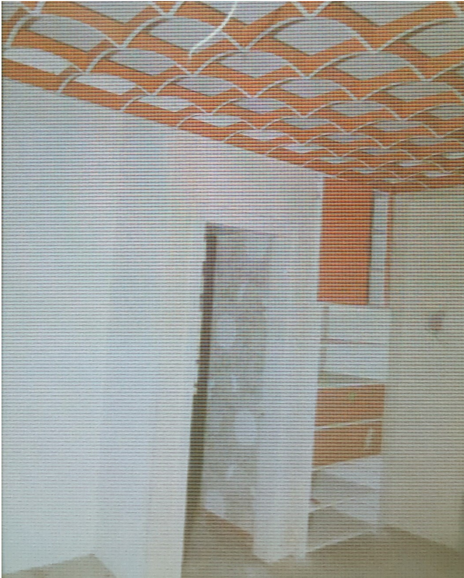
تصویر ۱۰- تزئینات کمد بندی و سقف تزئینی طبقه اول.