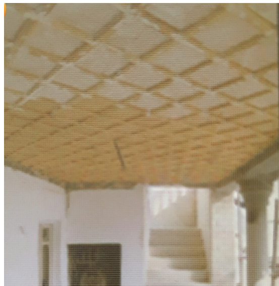
تصویر ۱۱- سقف چوبی تزئینی تراس همکف.