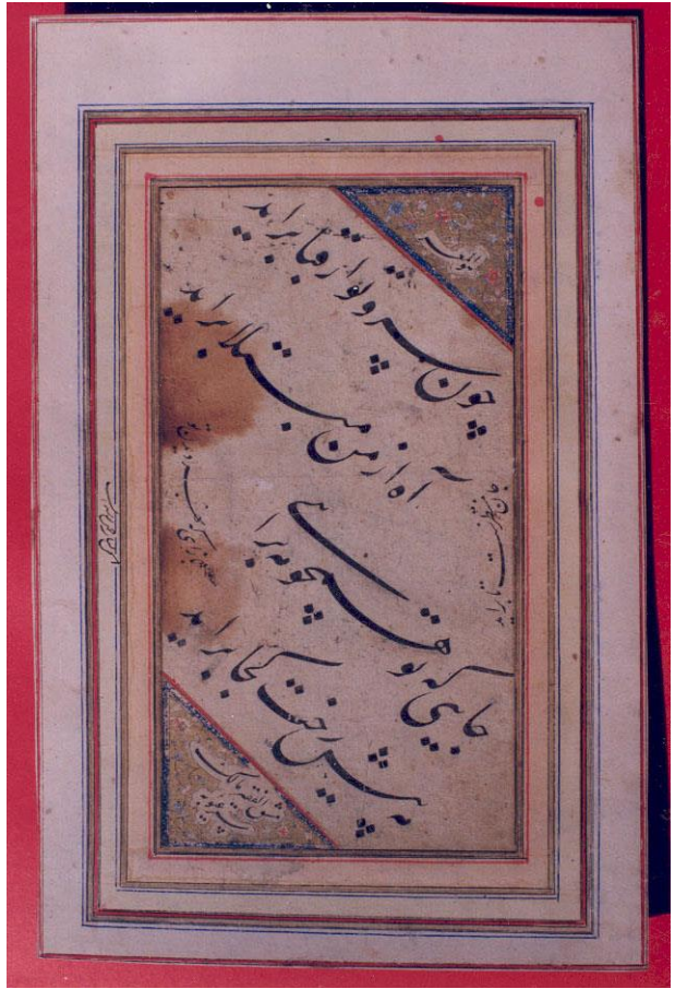
قطعه خط موزه میر عماد