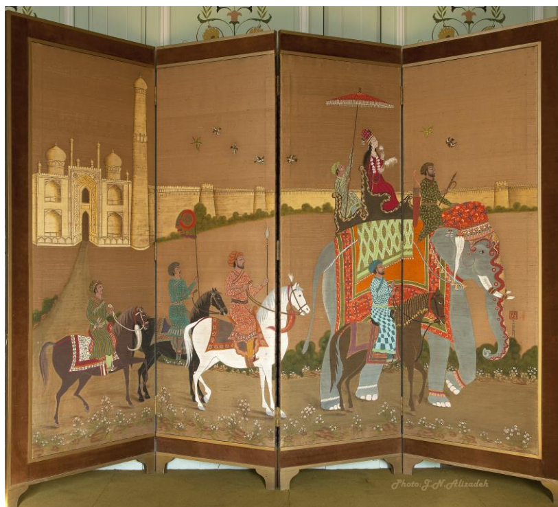
شماره ۶- پاراوان چهار لت، ۲۳۹×۱۷۸ سانتی متر، منطقه ساخت آسیای میانه (احتمالاً کشور هند)، دو رویه پارچه، در یک طرف نقاشی بر روی پارچه ساتن ابریشم با تصاویر مربوط به پادشاهی گورکانیان هند، مخزن موزه ملت، عکس جواد نجفعلی زاده (۱۳۹۵)