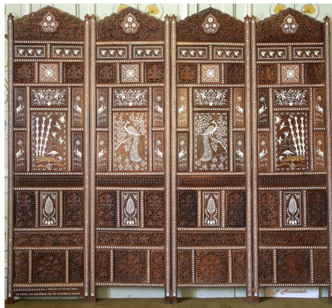
شماره ۸- پاراوان چهار لت، ۲۰۲×۱۸۶ سانتی متر، جنس چوب، تزئینات: مشبک- معرق با عاج، طرح های حیوانی/گیاهی/ اسلیمی/ هندسی، متن کتیبه: یادگاری به نشان محبت از طرف مردم، دولت و فرماندار پنجاب (یادآوری: سال ۱۳۳۸ شمسی محمدرضا پهلوی و فرح دیبا سفری رسمی به کشور پاکستان داشتند.)، مخزن موزه ملت، عکس جواد نجفعلی زاده (۱۳۹۵)