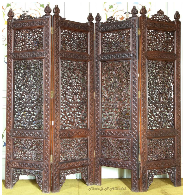
شماره ۵- پاراوان چهار لت، ۲۰۲×۱۸۶ سانتی متر، جنس چوب، تزئینات: منبت- مشبک- معرق با طرح های اسلیمی- گیاهی - هندسی، مخزن موزه ملت، عکس جواد نجفعلی زاده (۱۳۹۵)