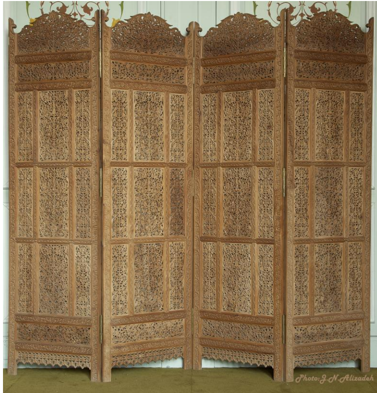
شماره ۷- پاراوان چهار لت، ۱۶۶×۱۵۰ سانتی متر، ساخت کشور هند، جنس چوب، تزئینات: مشبک- منبت کاری با طرح های اسلیمی- گیاهی- هندسی، متن کتیبه: ساخت هند - دهلی- قصر عاج ، مخزن موزه ملت، عکس جواد نجفعلی زاده (۱۳۹۵)