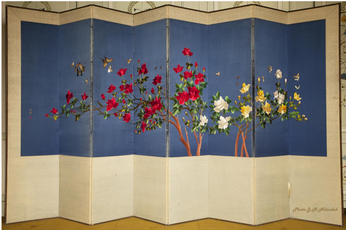
شماره ۱۶- پاراوان هشت لت، ۱۸۹×۳۵۶ سانتی متر، منطقه ساخت آسیای جنوب شرقی (احتمالاً ساخت کشور ژاپن)، گلدوزی طرح های گل رز سفید/ زرد/ سرخ به همراه پروانه بر روی پارچه ساتن ابریشم، مخزن موزه ملت، عکس جواد نجفعلی زاده (۱۳۹۵)