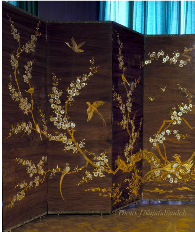
شماره ۹- پاراوان چهار لت، ۲۵۲×۱۸۶ سانتی متر، ساخت کشور ایران، جنس چوب، تزئینات: معرق دوربه (یک طرف پارچه ترمه، طرف دیگر چوب با طرح گل - مرغ ایرانی)، متن کتیبه: وزارت فرهنگ و هنر کارگاه منبت کاری مهر ماه ۱۳۴۴ شمسی. ، سالن بیلیارد، سرسرای اول موزه ملت