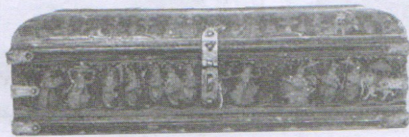
جمبه لاکي - ساخت هند - قرن ۱۸ و ۱۹ م - موزه مترو بولیتن