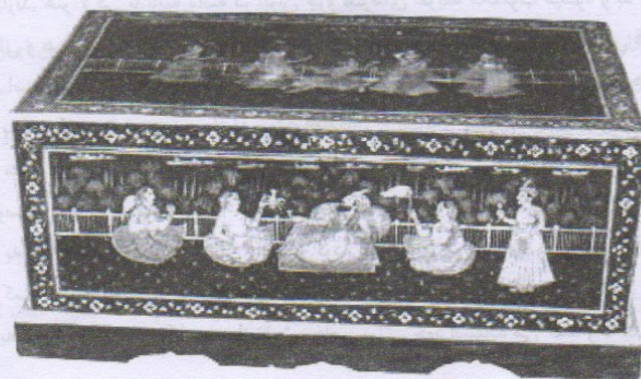
صندوقچه چوبی لاک - قرن ۲۰ - ساخت هند - مجموعه خصوصی