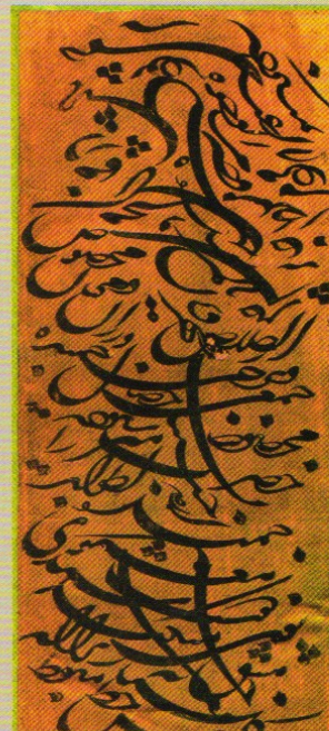
خط از گلستانہ