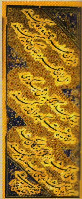
خط از میر علی