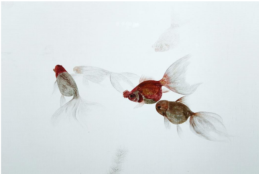
بخشی از تصویر گلدوزی ابریشمی سُو (Su) با نقش ماهی، سالن نشیمن خانواده ، طبقه دوم موزه ملت، عکس جواد نجفعلی زاده (1395)

2- سبک لوانژن زیو (Luanzhen xiu) یا گلدوزی نامنظم، این نوع سبک توسط یکی از اساتید هنر گلدوزی سُو به نام شویو لو (Shouyu Lv) در دهه 1930 میلادی توسعه داده شد. او در این روش با کمک گرفتن از خط های مورب و نخ های رنگانگ اقدام به ایجاد شکل ها، حیوانات و مناظر نمود. گرچه در گلدوزی های برگرفته از نقاشی های رنگ روغن غربی سنت استفاده از نخ های ابریشمی به منظور القای جلال و شکوه این هنر می باشد اما هنرمند درکنار آن می تواند برای ایجاد تنوع از نخ های غیرابریشمی نیز استفاده می نماید.