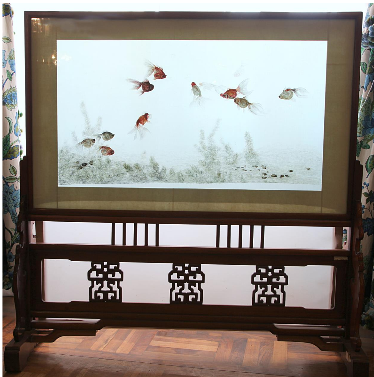
نابلو گلدوزی ابریشمی سُو (Su) با نقش ماهی، سالن نشیمن خانواده ، سرسرای طبقه دوم موزه ملت(1395)