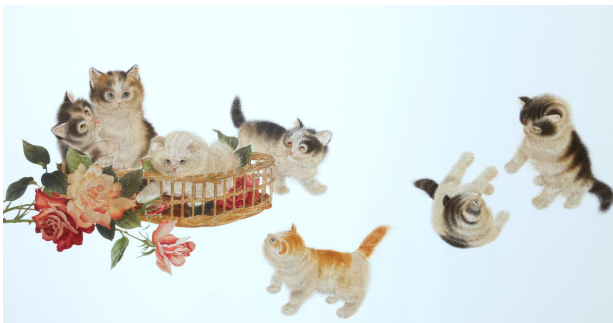
تابلو گلدوزی ابریشمی سُو (Su) با نقش گربه، سالن نشیمن خانواده، سرسرای طبقه دوم موزه ملت، عکس جواد نجفعلی زاده (1395)

در هنر گلدوزی سُو همواره به صورت سنتی تصاویری از پرنده ها و گل ها خودنمایی می کند، همچنین مناظری از طبیعت و نقاشی های قدیمی کشور چین (از سلسله های حکومتی این کشور) نیز جزو موضوعات این نوع گلدوزی محسوب می گردند، اما از سوی دیگر هنرمندان دوزنده این آثار در طی گذشت زمان، سعی نمودند با ایجاد تغییراتی هنر خویش را تا حد امکان با دوران زیست خود هماهنگ نمایند به طوری که از زمان سلسله تانگ/ Tang (907 - 618 م.) تا سلسله کینگ یا چینگ/ Qing (1912 - 1644 م.) عمده ترین نقوش این هنر شامل: پرنده هایی همچون طاووس، اردک، سیمرغ افسانه ای، گل، پروانه، سنجاک، زنبور، ماهی های در حال شنا، اسب های در حالت تاخت و بیرها بوده اند. با روند رو به افزایش تماس با دنیای غرب و سبک های جدید هنری ایجاد شده در میان آنها، گلدوزی سُو نیز از این ارتباط بی بهره نمانده و به تدریج نشانه هایی از ورود تاثیرات پیکرنگارها و تکنیک های نقاشی رنگ روغن غربی در آن مشاهده گردید.