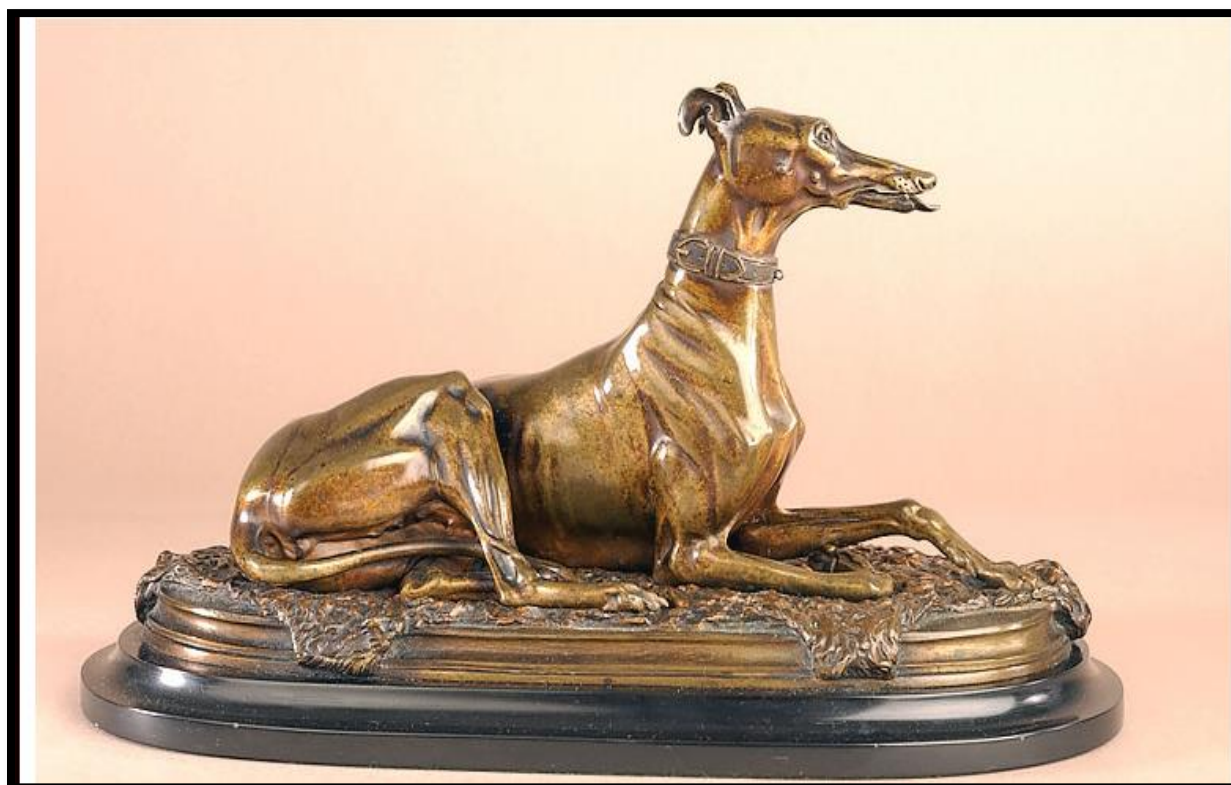
سگ تازی - ریخته گری شده از برنز- ساخته شده به سال 1880 میلادی- ابعاد 15/2 در 30/5 سانتی متر

جهت آشنایی بیشتر با این هنرمند، نمونه ای از این مجسمه ها را در ادامه مشاهده مینماییم.