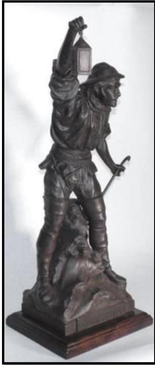
ریف خائن- برنز- ابعاد 88 سانتی متر