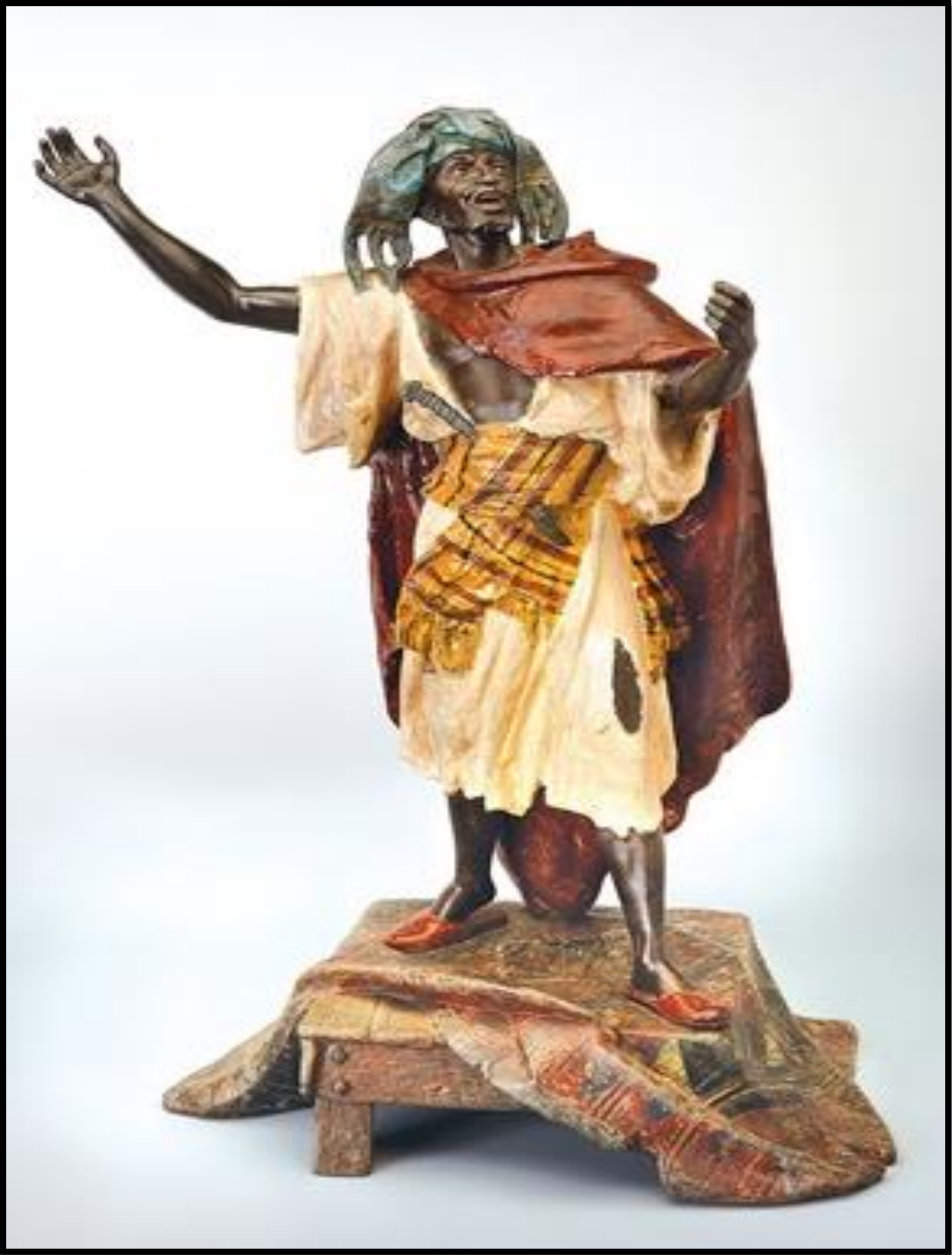
مرد شرقی- برنز با رنگ سرد- ابعاد 57 سانتی متر

اما مشهورترین اثر این هنرمند، بازگشت از شکار بزرگ است که در دنیا با عنوان