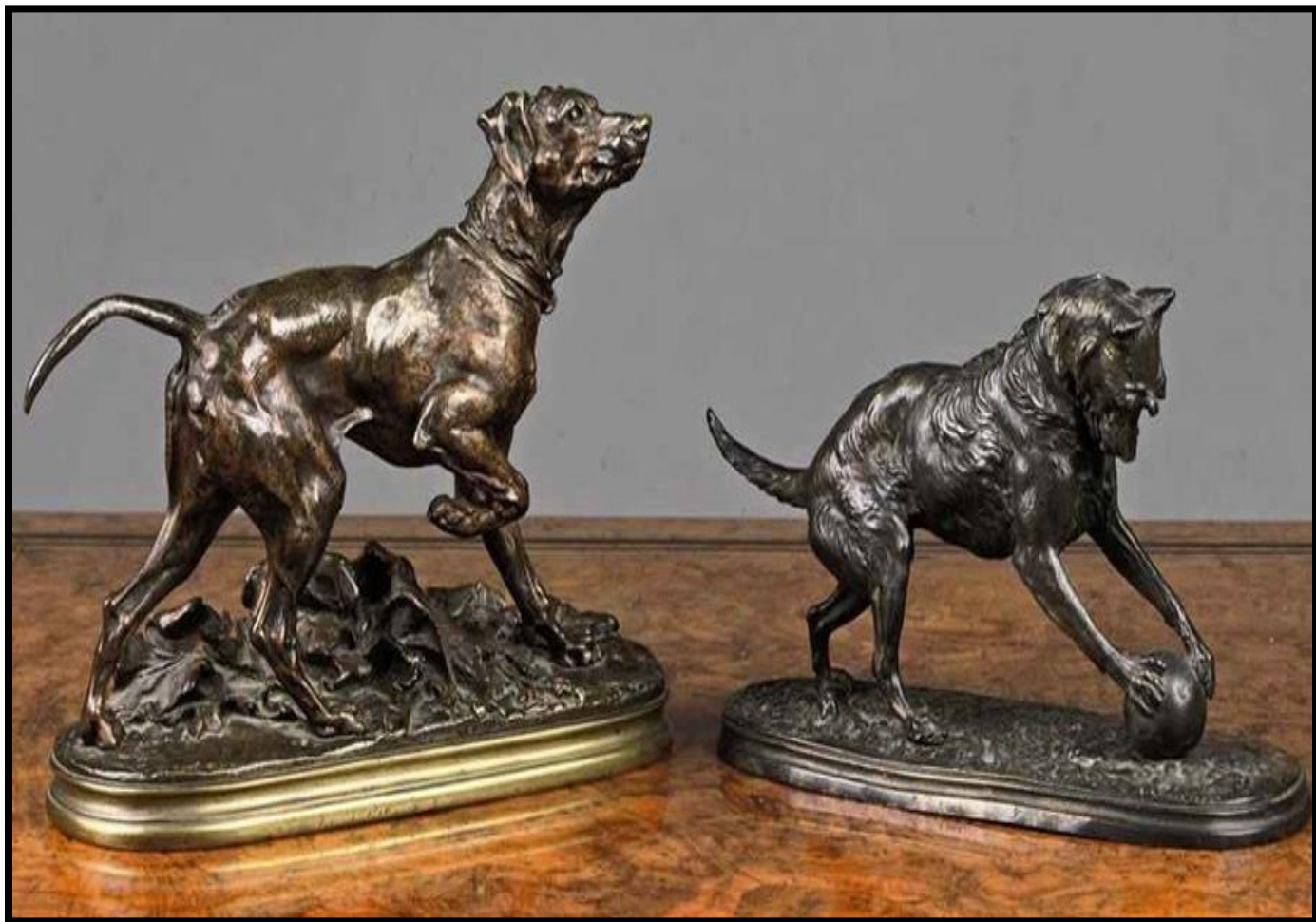
سگ ها و توپ- برنز پتینه شده- ابعاد 15/5 سانتی متر