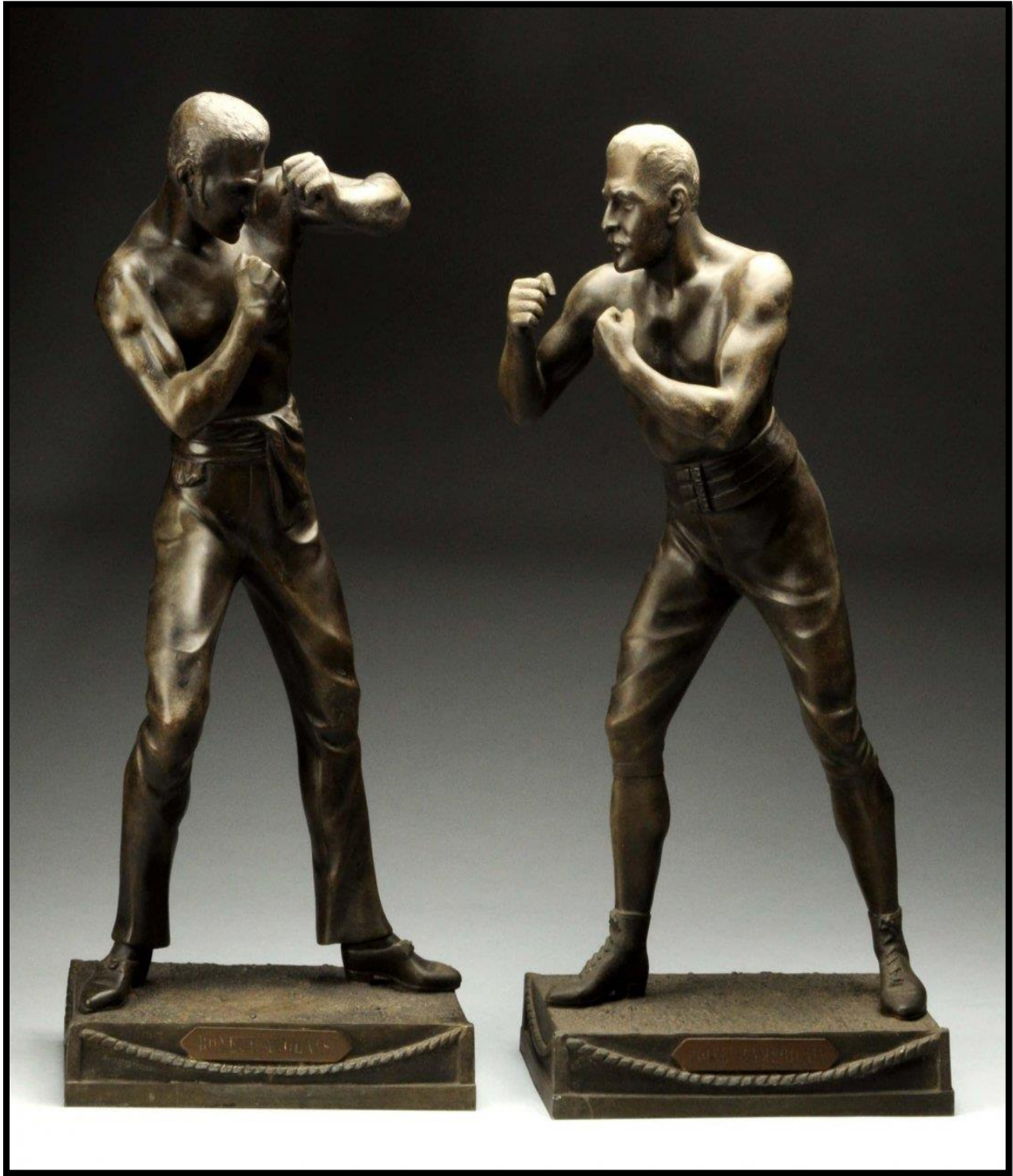
مبارزین - برنز