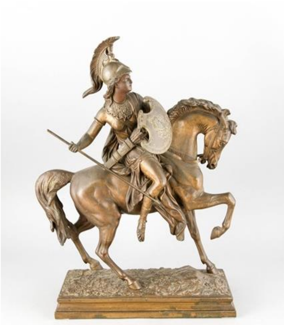
آمازون سوار بر اسب - برنز - ابعاد 48 سانتی متر