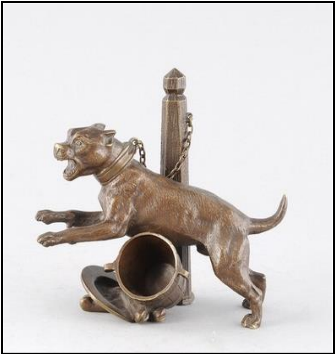
سگ در حال بازی - برنز پتینه شده- ابعاد 16 در 23/5 سانتی متر