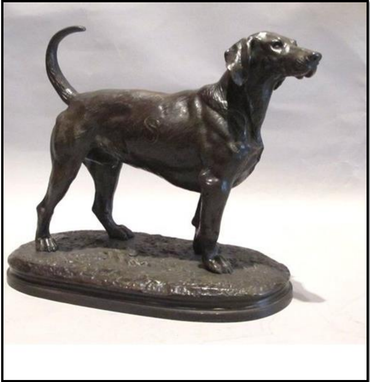
مجسمه بی نام- برنز با پتینه قهوه ای- ابعاد 25 در 28 سانتی متر