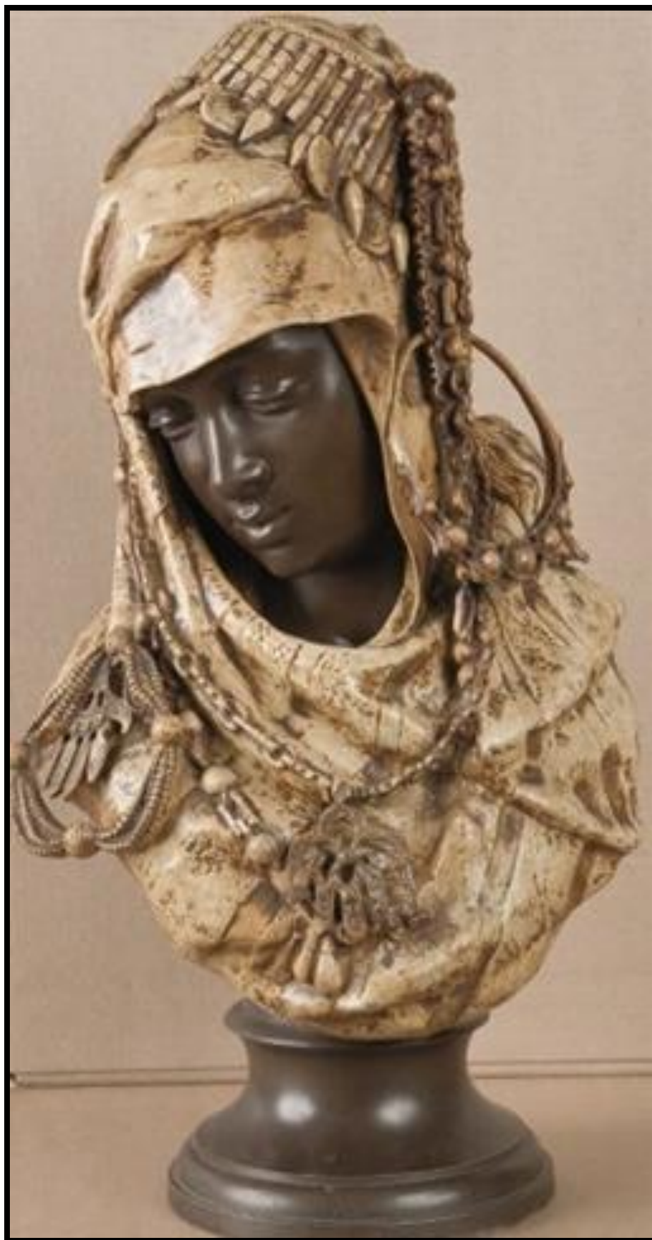
زیبایی شرقی- برنز با پتینه پلی کروم- ابعاد 80 سانتی متر