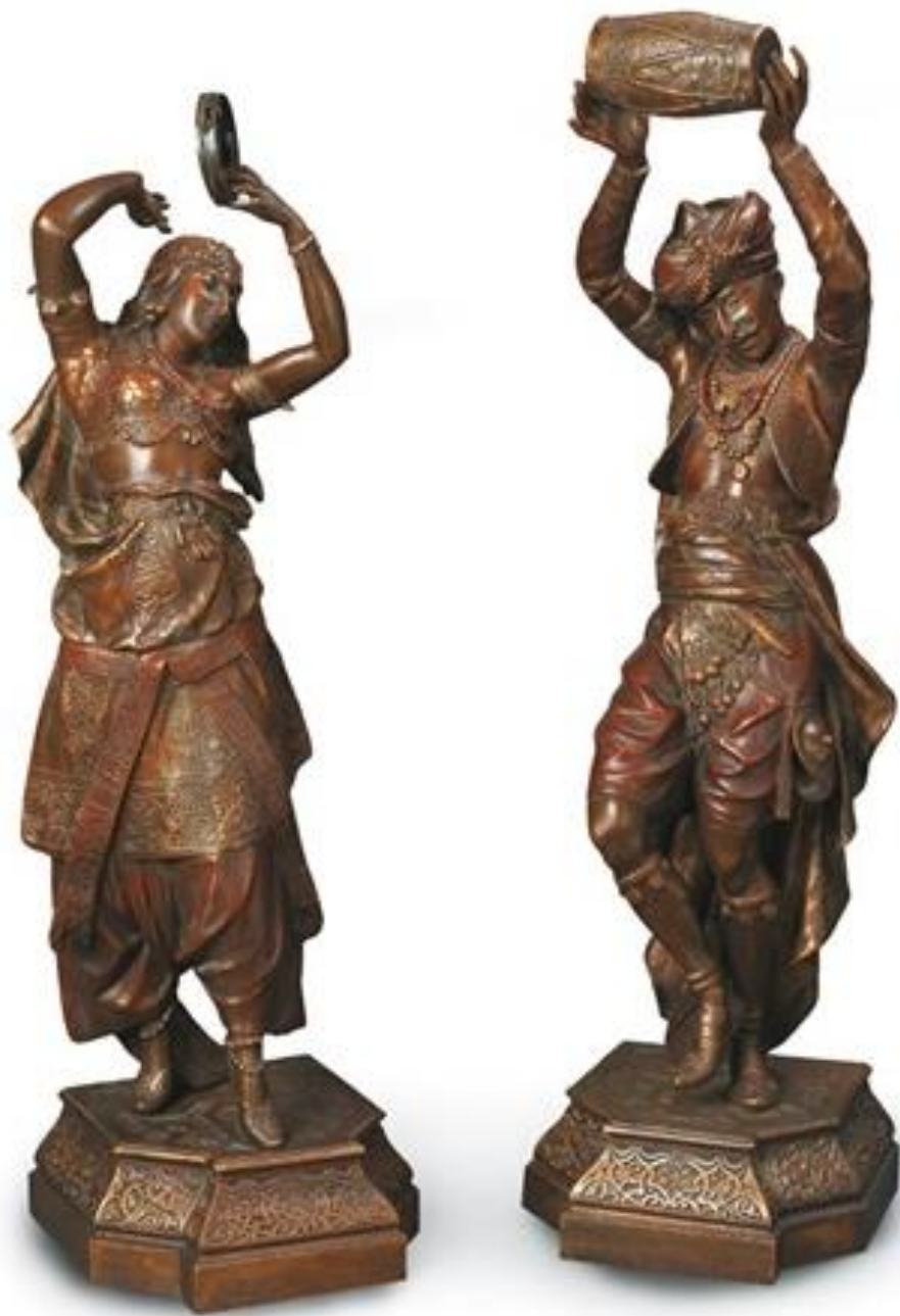
نوازندگان- برنز با پتینه پلی کروم- ابعاد 74 سانتی متر