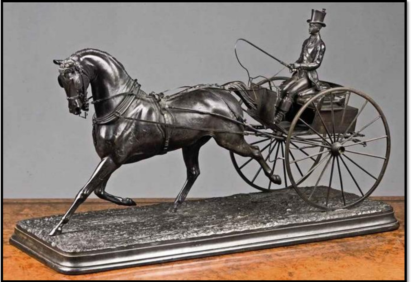
اسب و کالسکه- برنز- ابعاد 47 در 77 در 31 سانتی متر