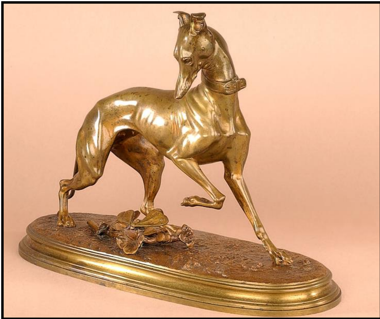
سگ تازی و پروانه- ریخته گری برنز- ساخته شده به سال 1875- ابعاد 20/3 در 28/2 سانتی متر

مجسمه بالا سگ ماده ای را نشان میدهد که یک پای خود را بلند کرده است و به پروانه ای در زیر خود نگاه میکند. به تصویر کشیدن سگ های ماده، یک کار غیر معمول در هنر مجسمه سازی به شمار آمده و جزو علایق خاص این هنرمند به شمار می آید. نوعی ترحم در چشم های سگ نمایان است که نشان دهنده هنر مجسمه ساز در نمایش جزییات هنری است.