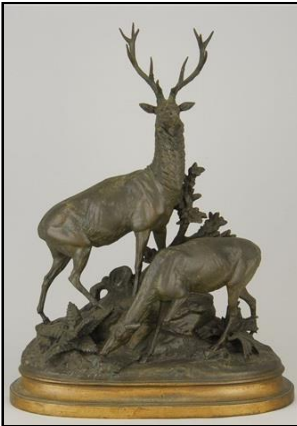
مجسمه بی نام- برنز- ابعاد 66 سانتی متر