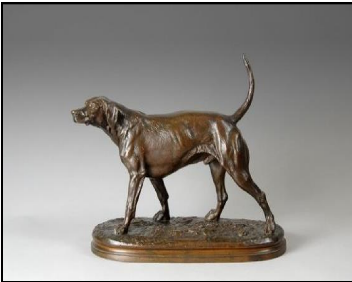
خون آشام- برنز- ابعاد 34 سانتی متر