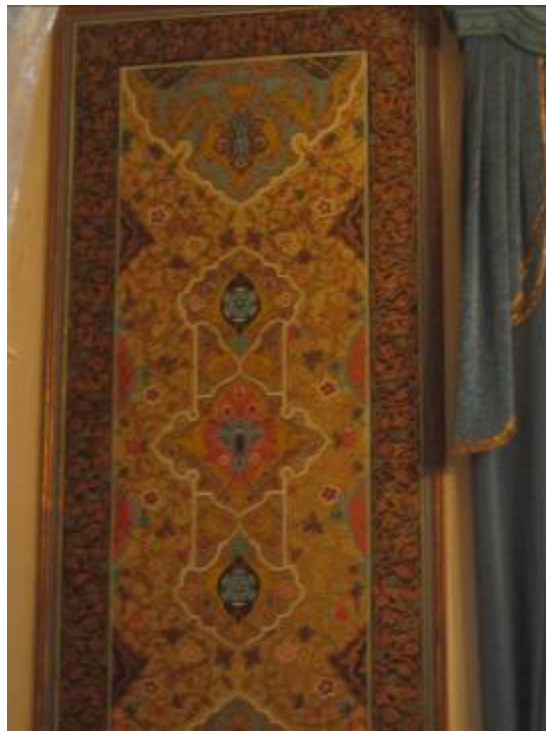
اتاق نهارخوری کاخ سبز (هنر تذهیب)