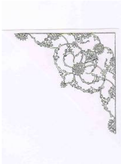
طرح لچک (۱/۴) اثر استاد بهزاد