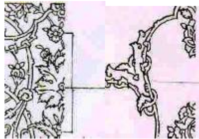
طرحهای اسلیمی و ختایی