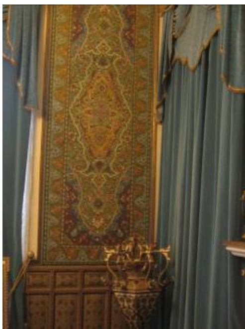
اتاق کار رضا شاه در کاخ سبز (هنرخاتم)