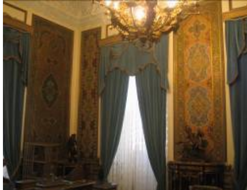
اتاق کار (اتاق خاتم)

درها کار شده است و آنچنان استادانه است که طرح فرش ایرانی را در اذهان بعضی عموم متبادر می نماید. در اتاق غذا خوری کاخ سبز ، کادرها بر خلاف اتاق کار بیشتر و کوچکتر شده و این به خاطر تفاوت در میزان فضای خالی برای تذهیب کاری در اتاق است ، تفاوت دیگر این اتاق با اتاق کار استفاده از رنگهای غیر متعارف در این هنر ( استفاده از رنگ مغز پیسته ای ) میباشد.