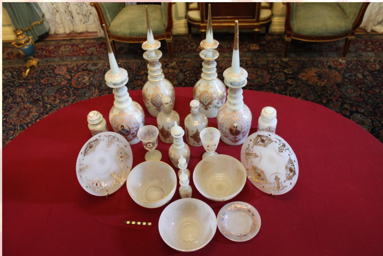
ظروف پس از پاکسازی و مرمت