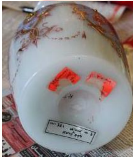
آلودگی سطحی ، برچسب های متعدد