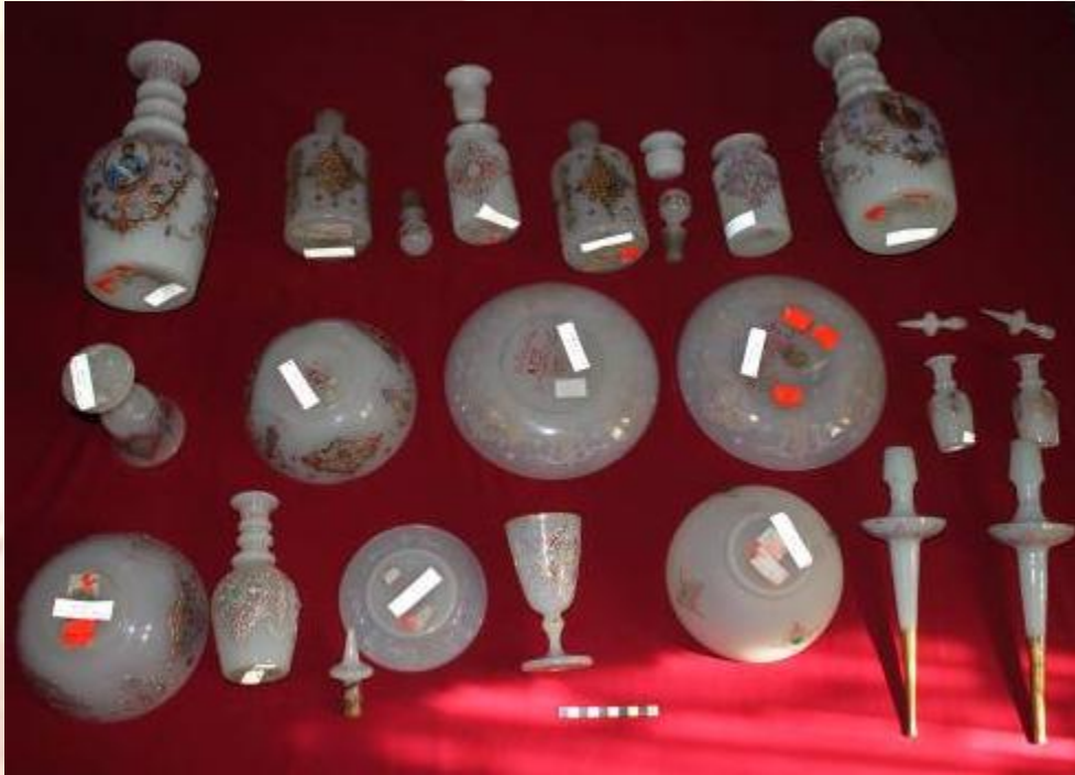
ظروف بارفتن کاخ موزه سبز