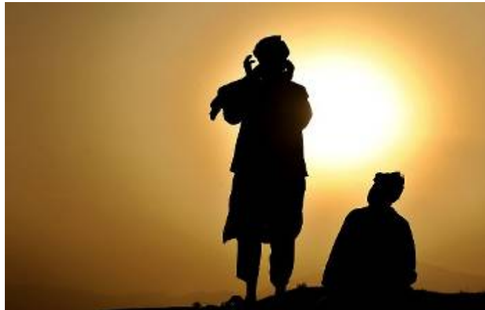
مرد افغان بالای تپه‌ای در کابل مردم را اذان می‌گوید و به خواندن نماز در ماه مبارک رمضان فرامی‌خواند.