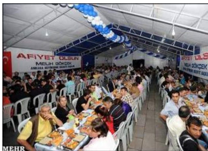
" مراسم ماه رمضان در ترکیه "