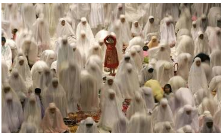
زنان مسلمان در نماز مغرب اولین روز ماه مبارک رمضان به مسجدی در سورابیا واقع در شرق جاوه اندونزی شرکت کرده‌اند.