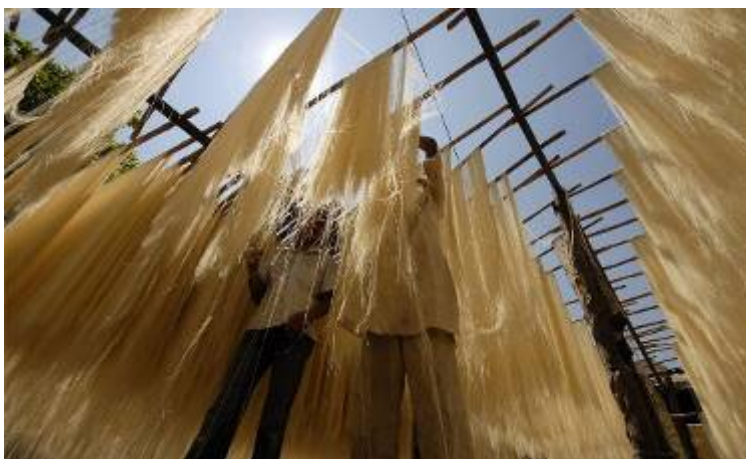
کارگران در شهر حیدرآباد هند، ورمیشل (رشته فرنگی) را خشک می‌کنند. مسلمانان این کشور، ورمیشل را به صورت غذای ویژه در ماه رمضان می‌خورند.