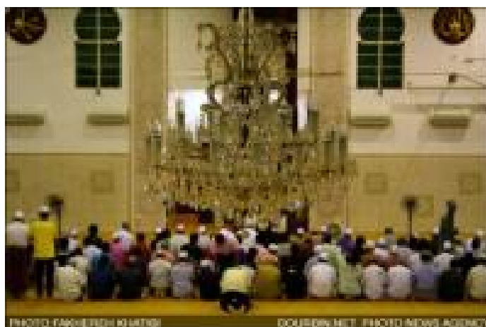
" مراسم ماه مبارک رمضان در مالزی "