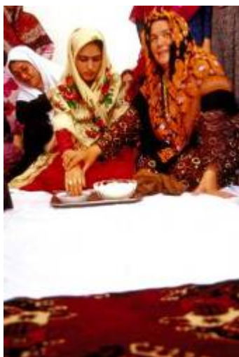
رسم گذاردن روغن زرد در دهان مادر شوهر