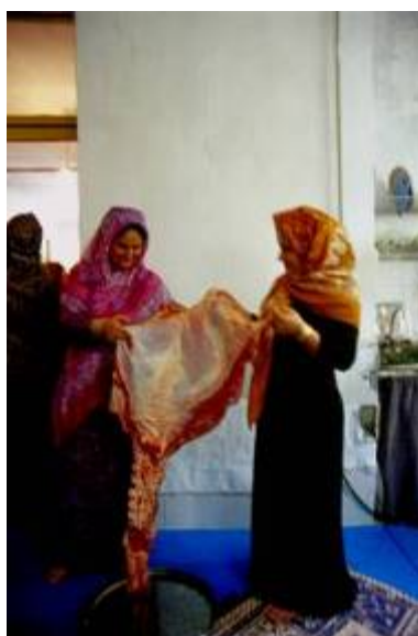
نمونه ای از گوشت حیوان قربانی شده ، قبل از الصاق وجوه نقدی به آن

این مراسم از صبح زود و با قربانی کردن حیوانی توسط پدر داماد همچون: شتر، گاو، گوسفند و ... آغاز می گردد. پس از اتمام این رسم گوشت قسمتی از گردن و سینه حیوان ذبح شده را به شکل تقریباً مثلث متساوی الساقین جدا نموده، بعد بر سر هر کدام از رؤس آن اسکناسی را به عنوان هدیه می بندند. ۱ پس از آماده سازی این بخش از گوشت قربانی آن را به نیت پیشکش به خانه عروس می فرستند. ۲