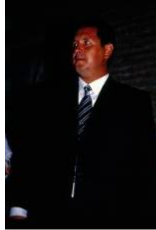
داماد ترکمن با ظاهر و پوشاک امروزی داماد ترکمن با ظاهر و پوشاک سنتی