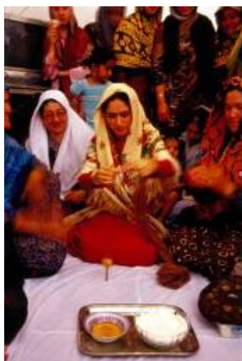
عروس در حال ریسیدن نخ