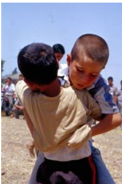
برگزاری مسابقه کشتی پهلوانی خردسالان