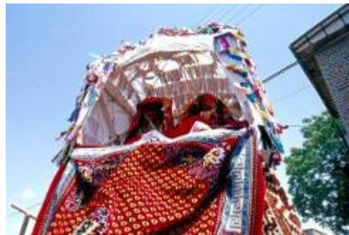
جایگاه نشستن عروس در کجاوه

بعد از اتمام این آداب و رسوم به منظور بردن عروس به خانه داماد وی را سوار بر کجاوه یا ماشین از قبل آماده شده می نمایند. پیش از حرکت، مادر عروس با ظرفی حاوی آرد به نزدیک وسیله ( ماشین یا کجاوه) آمده و با ریختن آرد بر روی سر شتر یا قسمت جلوی ماشین شادمانی و تبرک را برای زندگانی آنان آرزو می کنند. سپس کاروان حامل عروس و داماد به راه می افتاد.