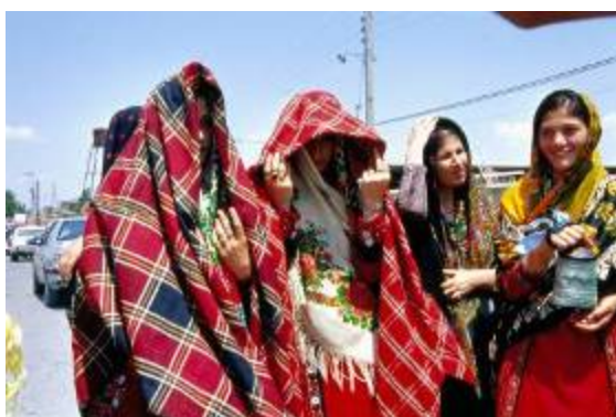
خانواده عروس وی را تا مسیری کوتاه همراهی می کنند.