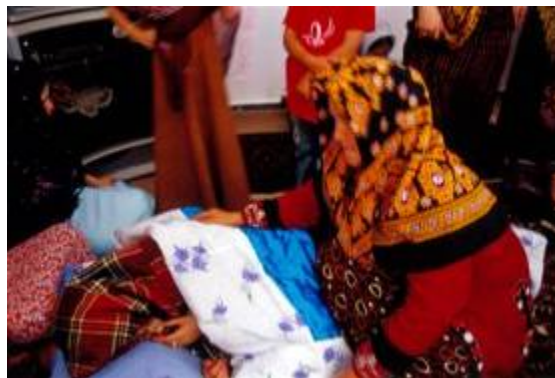
رسم خوابیدن عروس به صورت نمادین در میان میهمانان

- پس از پیاده نمودن عروس از کجاوه او را وارد اتاقی که از قبل میهمانان در آنجا جمع شده اند، می نمایند. ابتدا عروس را در وسط اتاق میان میهمانان می نشاندند. در این زمان یکی از زنان بالش و پتوئی را می آورد. در این حالت عروس موظف است در میان میهمانان سر خود را بر بالش نهاده سپس پتو را بر روی او می اندازند تا برای لحظه ای به صورت نمادین در آنجا بخواهد. هدف از این عمل در واقع القای آرامش و عادت ماندگاری به عروس در خانه جدید است.