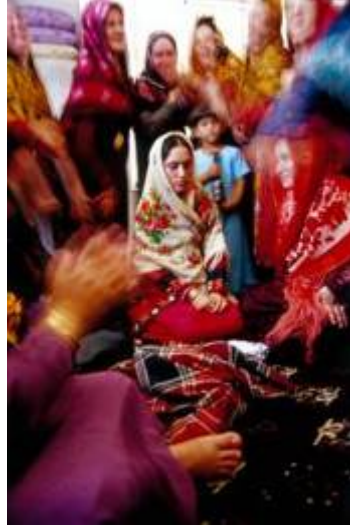
مراسم گذاردن روسری آلیچه بر سر عروس بردن عروس با روسری مخصوص بر سر وی

بعد از اتمام این آداب و رسوم به منظور بردن عروس به خانه داماد وی را سوار بر کجاوه یا ماشین از قبل آماده شده می نمایند. پیش از حرکت، مادر عروس با ظرفی حاوی آرد به نزدیک وسیله ( ماشین یا کجاوه) آمده و با ریختن آرد بر روی سر شتر یا قسمت جلوی ماشین شادمانی و تبرک را برای زندگانی آنان آرزو می کنند. سپس کاروان حامل عروس و داماد به راه می افتاد.