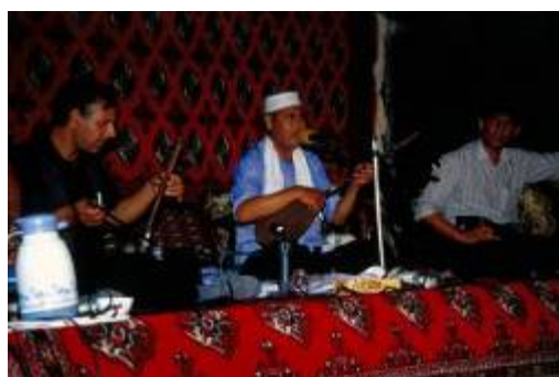
اجرای موسیقی ترکمنی در مراسم جشن داماد

پس از صرف شام معمولاً یکی از برنامه های زیر جهت سرگرمی و حضور میهمانان اجرا می گردد. - قرآن خوانی - بحث های مذهبی در مورد دین ( احکام ) - اجرای موسیقی - رقص خنجر ۳ در انتها و اتمام هرکدام از مراسم نام برده، میهمانان با خانواده داماد خداحافظی کرده و به منازل خود می روند و مابقی جشن به روز بعد موکول می گردد.