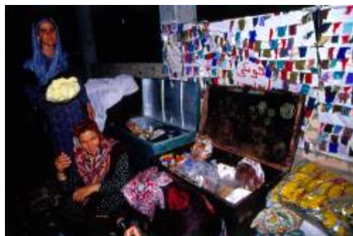
صندوق های آماده شده جهت ارسال به خانه عروس