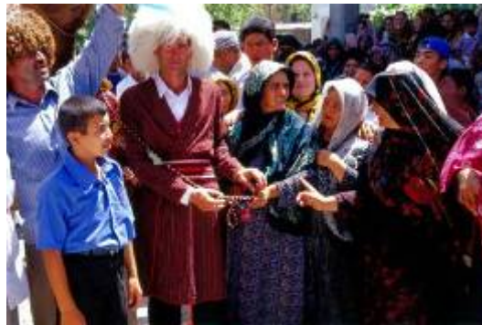
مادر داماد افسار شتر را به دست می گیرد تا رسم احترام گذاری را به عروس یادآور نماید.

- در بدو ورود کاروان به محوطه خانه، داماد افسار شتر ( کجاوه ) را به دست مادر خود می دهد. در این لحظه مادرشوهر برای چند قدم کجاوه را به حرکت درمی آورد تا این رسم را یادآور شود، که همواره عروس باید مطیع و فرمانبر بزرگان خانواده بوده و احترام آنها را حفظ نماید.