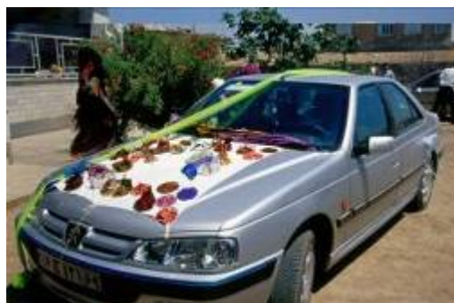
کاروانی مدرن متشکل از ماشین های تزئین شده توسط پارچه برای بردن عروس