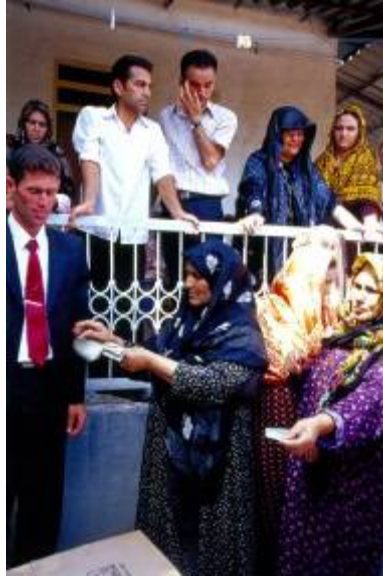
پرداخت پول نقد به عنوان هدیه به شخص داماد از سوی میهمانان خانواده عروس

- در بدو ورود کاروان به محوطه خانه، داماد افسار شتر ( کجاوه ) را به دست مادر خود می دهد. در این لحظه مادرشوهر برای چند قدم کجاوه را به حرکت درمی آورد تا این رسم را یادآور شود، که همواره عروس باید مطیع و فرمانبر بزرگان خانواده بوده و احترام آنها را حفظ نماید.