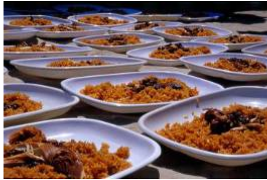
چکیرمه غذای سنتی که در روز جشن جهت پذیرائی میهمانان تهیه می شود.

- حلقه " آنه " ۱ از دیگر آئین هایی است که باید اجرا گردد. این حلقه را بعد از عقد بر سر عروس و در زیر سرپوش وی قرار می دهند. خانم های متأهل ملزم به استفاده از آن در تمام دوران زندگی خود می باشند. در واقع این حلقه نشانه ای تأهل و ازدواج بوده. در میان برخی از طوایف ترکمن رسم بر این است، به نسبت طول زمانی که از مدت ازدواج می گذرد بر ارتفاع این حلقه افزوده می شود.