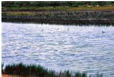
نمایی از استان گلستان ( منطقه اینچه برون )

از دیگر آثار مکشوفه در این نواحی می توان از ظروف سفالی خاکستری رنگ نام برد، که در بسیاری مواقع بروی آن نقوشی مرکب از خطوط موازی یا شکسته به چشم می خورد ۱ . با اندک دقتی در این کاوش ها می توان نتیجه گرفت که از هزاره پنجم قبل از میلاد مسیح در قسمت شرقی سواحل دریای خزر تمدن پیشرفته ای وجود داشته. از جمله مناطق موجود در دشت گرگان که دارای سوابق تاریخی و پیشینه باستانی است می توان به آق تپه، شاه تپه، غار کیارام، دیوار دفاعی گرگان ۲ و ... اشاره نمود.