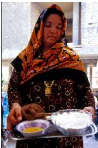
سینی حاوی آرد، روغن و دوک نخ ریسی