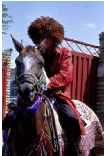
پیش قراولان مخصوص کاروان سنتی به همراه گروه مشایعت کنندگان