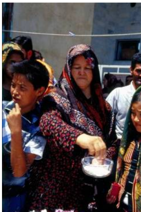
مادر عروس در حال پاشیدن آرد