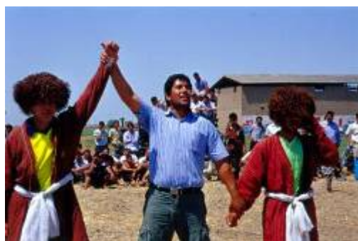
اعلام برنده مسابقه توسط یکی از پهلوانان پیشکسوت و نام آور این رشته ورزشی