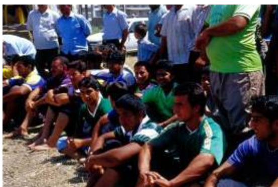
گروهی از پهلوانان جهت شرکت در مسابقه