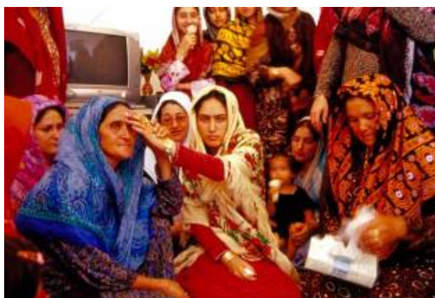
رسم زدن آرد بر پیشانی مادرشوهر