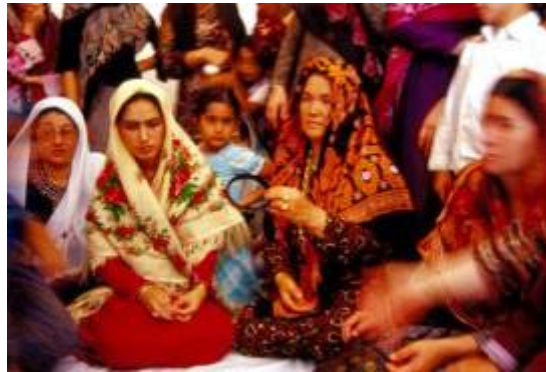
گذارن حلقه آنه بر سر عروس

- حلقه " آنه " ۱ از دیگر آئین هایی است که باید اجرا گردد. این حلقه را بعد از عقد بر سر عروس و در زیر سرپوش وی قرار می دهند. خانم های متأهل ملزم به استفاده از آن در تمام دوران زندگی خود می باشند. در واقع این حلقه نشانه ای تأهل و ازدواج بوده. در میان برخی از طوایف ترکمن رسم بر این است، به نسبت طول زمانی که از مدت ازدواج می گذرد بر ارتفاع این حلقه افزوده می شود.