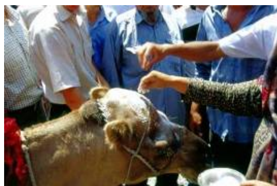
مراسم ریختن آرد بر سر حیوان حامل کجاوه عروس

از دیگر وظایف اصلی این کاروان رفتن به خانه های بزرگان طایفه، اهالی محترم محل و یا بزرگان مذهبی - دینی است، تا دعای خیر آنان را برای زندگی خود خواسته و به این طریق برکت را در زندگی وارد نمایند.