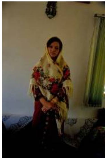
عروس ترکمن در لباس مخصوص جشن عروسی