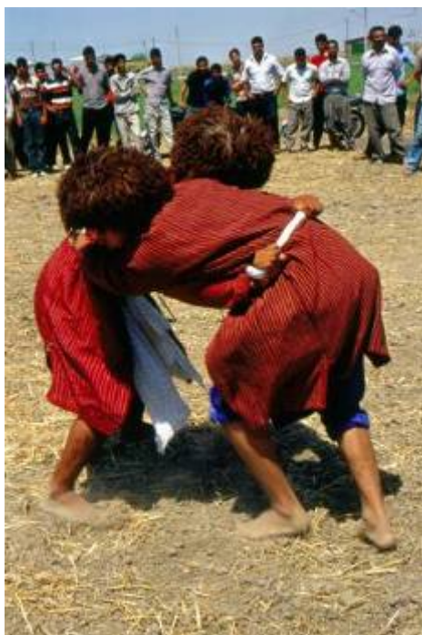
برگزاری مسابقه کشتی بین پهلوانان بزرگسال طایفه