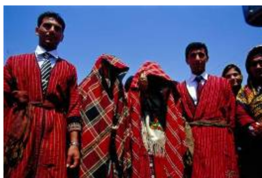
گروه استقبال کنندگان به همراه عروس و داماد

پس از طی تمام این مراحل و رسیدن عروس به خانه داماد چند رسم دیگر نیز در آنجا اجرا می گردد که در اینجا به صورت خلاصه بدان ها اشاره می گردد: - همزمان بردن عروس توسط کاروان مشایعت کنندگان خانواده عروس کلیه وسایلی که به عنوان جهیزیه برای زندگی جدید آنها تهیه نموده اند توسط وسیله نقلیه به خانه داماد می فرستند. در این زمان تمامی میهمانانی که در خانه عروس از قبل دعوت گردیده اند هدایای خود را ( نقدی ) به عروس داماد تقدیم می کنند.