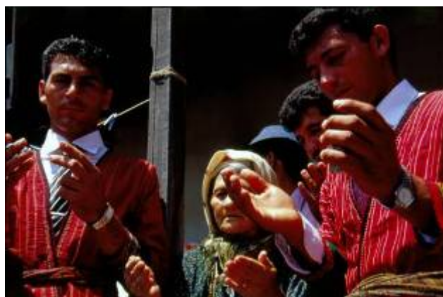
ادای احترام کاروانیان حامل کجاوه عروس به بزرگان طایفه و خواستن دعای خیر آنان

از دیگر وظایف اصلی این کاروان رفتن به خانه های بزرگان طایفه، اهالی محترم محل و یا بزرگان مذهبی - دینی است، تا دعای خیر آنان را برای زندگی خود خواسته و به این طریق برکت را در زندگی وارد نمایند.