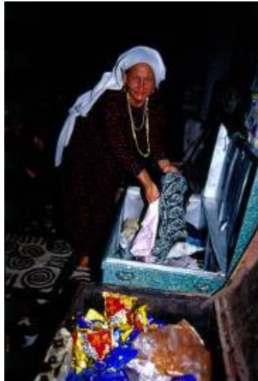
هدایایی که برای پیشکش به منزل عروس می فرستند.