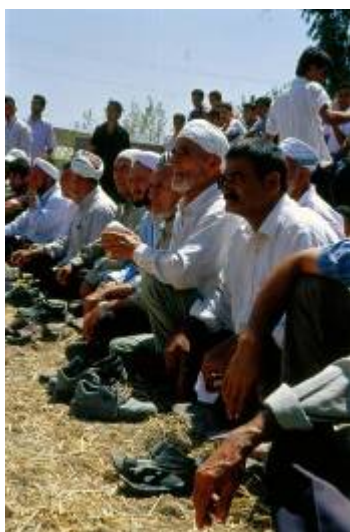
جمعی از تماشاچیان که به صورت دایره وار دور تا دور محوطه میدان مانند حضور دارند.

در یک سوی این میدان سکوی بلندی توسط وسیله ای مانند تراکتور ایجاد می کنند تا گویندگان و مجریان برگزاری این مراسم در آنجا ایستاده و نتایج حاصل را به وسیله بلندگو اعلام نمایند. وسط این میدان به قدری است که، همزمان قابلیت اجرای چند مسابقه کشتی را داراست. سن افراد مجاز شرکت کننده در این مسابقه محدوده سنی کودکان تا بزرگسالان را دربرمی گیرد. کشتی گیران همه از مردان طایفه می باشند اما تماشاچیان آنها می توانند شامل زنان و مردان فامیل، طایفه و همسایگان و ... باشند. امروزه کشتی پهلوانی یکی از رشته های ورزشی مهم درمیان کشورهای همسایه شمالی ایران و استان های ترکمن نشین ما محسوب شده تا جائیکه درمیان کشورهای همجوار مسابقات دوره ای نیز برگزار می گردد. این ورزش مانند سایر ورزش ها از قوانین خاص خود برخوردار بوده. در این نوع ورزش وجود داورهای اصلی میدان، داورهای کناری از جمله شرایط اصلی و مهم برگزاری می باشد. هرکشتی گیر مجبور به پیروی از قوانین و قواعدی خاص ورزشی بوده. در صورت پیروزی هر نفر به رسم یادبود به وی جوایز ویژه نقدی از سوی داماد و پدر او تعلق می گیرد. 1