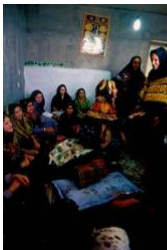
رسم نشستن بر کمر عروس جهت ماندگاری عروس در خانه جدید

- خانمی از بزرگان و نزدیکان خانواده داماد درحالی که عروس هنوز به همان ترتیب روی زمین خوابیده برای چند لحظه بر روی کمر وی می نشیند. این عمل در باورهای آنان این گونه جای گرفته که با اجرای چنین کاری عروس احساس سنگینی نموده و همواره درخانه داماد باقی می ماند.