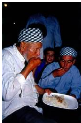
صرف شام و پرداخت هدیه نقدی در مراسم جشن داماد

پس از صرف شام معمولاً یکی از برنامه های زیر جهت سرگرمی و حضور میهمانان اجرا می گردد. - قرآن خوانی - بحث های مذهبی در مورد دین ( احکام ) - اجرای موسیقی - رقص خنجر ۳ در انتها و اتمام هرکدام از مراسم نام برده، میهمانان با خانواده داماد خداحافظی کرده و به منازل خود می روند و مابقی جشن به روز بعد موکول می گردد.